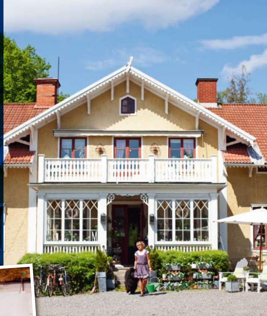
Tillsammans med den älskade fyrfotabjässen Gordos framför prästgården.