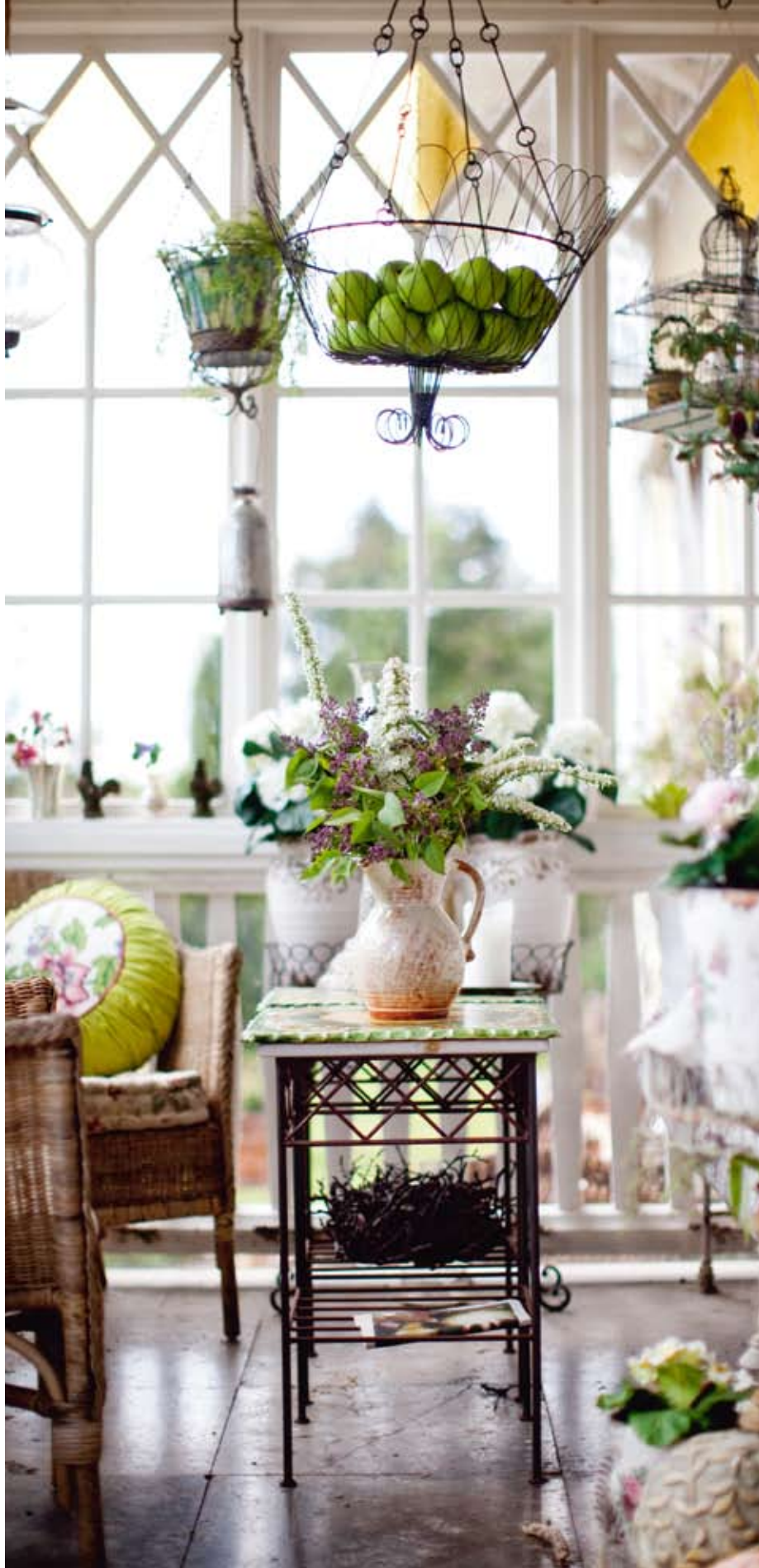
En somrig oas, glasverandan med olika fynd från Provence.

– Att jag får utlopp för min kreativitet och får arbeta med vackra saker. Jag älskar att skapa miljöer där man kan få njuta av livets goda. Det kan vara en oas i trädgården eller en färgsprakande dukning. Mitt förra liv var fantastiskt också, på sitt sätt, så jag måste säga att jag känner mig mycket lyckligt lottad. ●