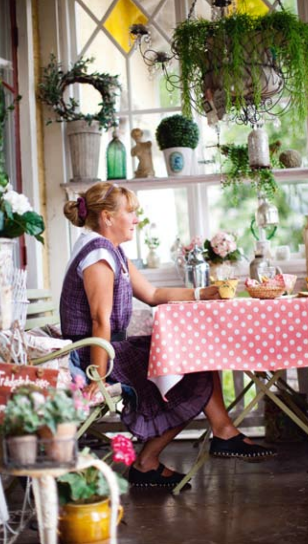
Lunchpaus på den vackra glasverandan.